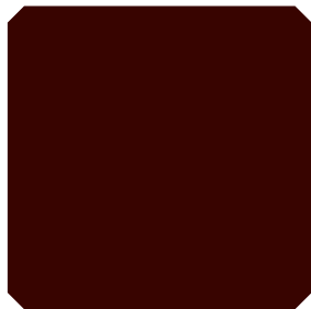
ALTERNATIVNO TAMNO SMEĐA (ATS)