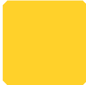
SVIJETLO ZLATNA (SZ)