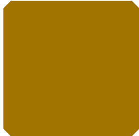
TAMNO ZLATNA (TZ)