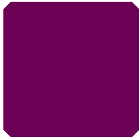
TAMNO PINK (TP)