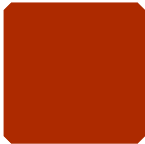
TAMNO NARANČASTA (TN)