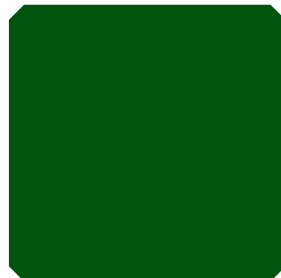
TAMNO ZELENA2 (TZ2)