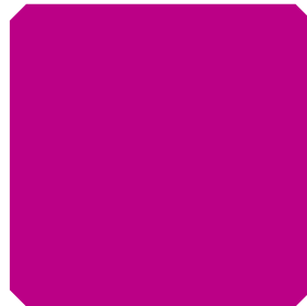
SVIJETLO PINK (SP)